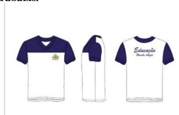
TABELA - CAMISETAS

Conforme imagem/foto ilustrativa abaixo.