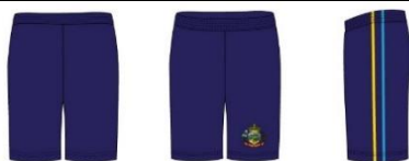
TABELA – BERMUDAS