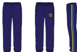
TABELA – CALÇAS

Modelo conforme imagem ilustrativa em anexo.