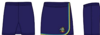
TABELA – SHORTSAIA

Manufatura: fechamento lateral, entre pernas e ganchos realizados em overloque, com linha 100% poliéster. Conforme imagem ilustrativa abaixo.